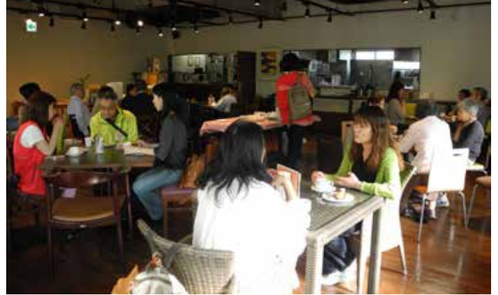
総会終了後は茶話会として、comm cafeでドリンク・お菓子をふるまい、参加者が話に花を咲かせていた。

「交流会」から「総会」に変更した一つの大きな理由は、関係者が広がっているからだ。協会事業のボランティアのみならず、多くの関係者が関わって、事業が運営されている。例えば相談事業では、以前にも増して他機関との連携が密になっている。箕面市社会福祉協議会(以下、社協)のケースワーカーやソーシャルワーカーとも連携しながら、相談対応をおこなっている。しかしながら、相談対応にかかわるやりとりは頻繁におこなわれている。社協の担当者が協会事業の内容や、協会で活動しているボランティアのようすについてはあまり知らないというのが現状だ。また、大阪大学箕面キャンパスにある、学生・若者が地域とつながる居場所「ひとこま」や箕面市立市民ギャラリー「チカノ」など、協会事業がさまざまな拠点・地域で広がっていく中で、さまざまな役割の関係者が増えていく一方、その関係者どうしが出会い、悩みや葛藤も含め、ふだんの活動について共有する場がない、