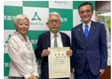
箕面市役所にて、箕面市長(右)、箕面市議会議長を表敬訪問した。