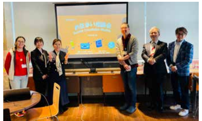
↑相談会を主催した「みのパラ」のメンバーと協会スタッフ

今回は「部屋探し(賃貸編)」として、日本で部屋を探して契約するにあたっての基本的な内容について多言語(日本語・英語・中国語・韓国語)での情報が提供された。耳慣れない言葉の説明(保証人、敷金、礼金、原状回復義務など)や「傷があったら写真を撮って、日付をメモしておく」といった部屋を借りる時のワンポイントアドバイスなど、スライド40枚ほどの資料は「役に立つ」と好評だった。参加者からは、「海外から来て間もなく、日本に来て初めての賃貸契約だが『現住所』の記入を求められた。どうしたら良いか」「家を借りる時に収入証明書は必ずいるのか」など、たくさんの質問が挙がっ