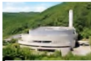
↑環境クリーンセンター Environmental Clean Center

問合せ: 環境クリーンセンター 電話: 072-729-4280 FAX: 072-728-3156 e-mail: sisetu@maple.city.minoh.lg.jp