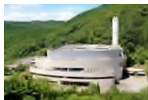
↑ 環境クリーンセンター Environmental Clean Center

問合せ: 環境クリーンセンター 電話: 072-729-4280 FAX: 072-728-3156 e-mail: sisetu@maple.city.minoh.lg.jp